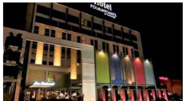
Bolzano: Hotel Four Points by Sheraton/SPA ****

These are the hotels of the 16th Winter RAID