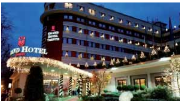
Grand Hotel Trento ****

These are the hotels of the 16th Winter RAID